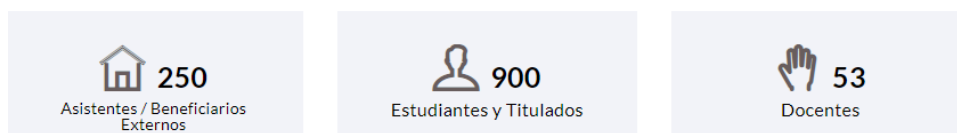
Participantes del 2015 al 2019

Educación Superior, así como también a la comunidad jurídica en general de la región. Por lo tanto, el objetivo de estas jornadas cada año ha sido fomentar la igualdad y diálogo en sus múltiples dimensiones, tales como participación política y representación de la mujer, la comunidad LGBTIQ, el medioambiente, la comunidad migrante, entre otras. Hasta la fecha, estas iniciativas han convocado a 1203 personas a participar y dialogar en este espacio reflexivo sobre igualdad e inclusión.