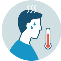
FEVER ABOVE 38 DEGREES CELSIUS

If you are an international student at U. Mayor and have symptoms of COVID-19 or CoronaVirus, follow these steps: