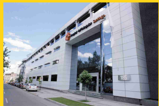
Hospital del Trabajador